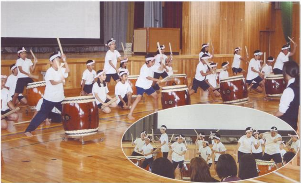
9月17日大町市立美麻小中学校で開催された「少年の主張長野県大会」のアトラクション風景です。美麻小学校5・6年生の皆さんによる勇壮な太鼓の演奏を披露していただき、ありがとうございました。